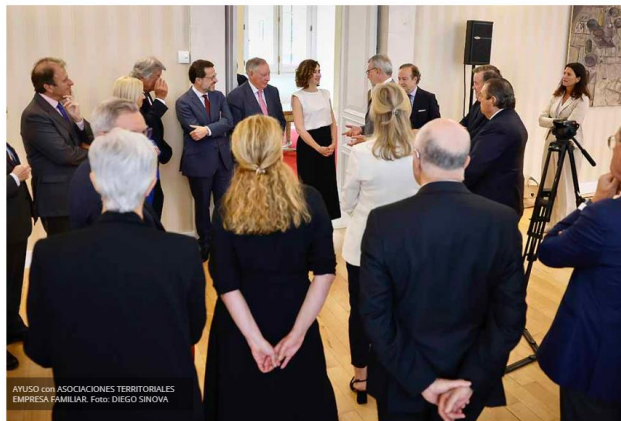
AYUSO con ASOCIACIONES TERRITORIALES EMPRESA FAMILIAR.

This ad will be displayed inside vertical meta bar on single post templates